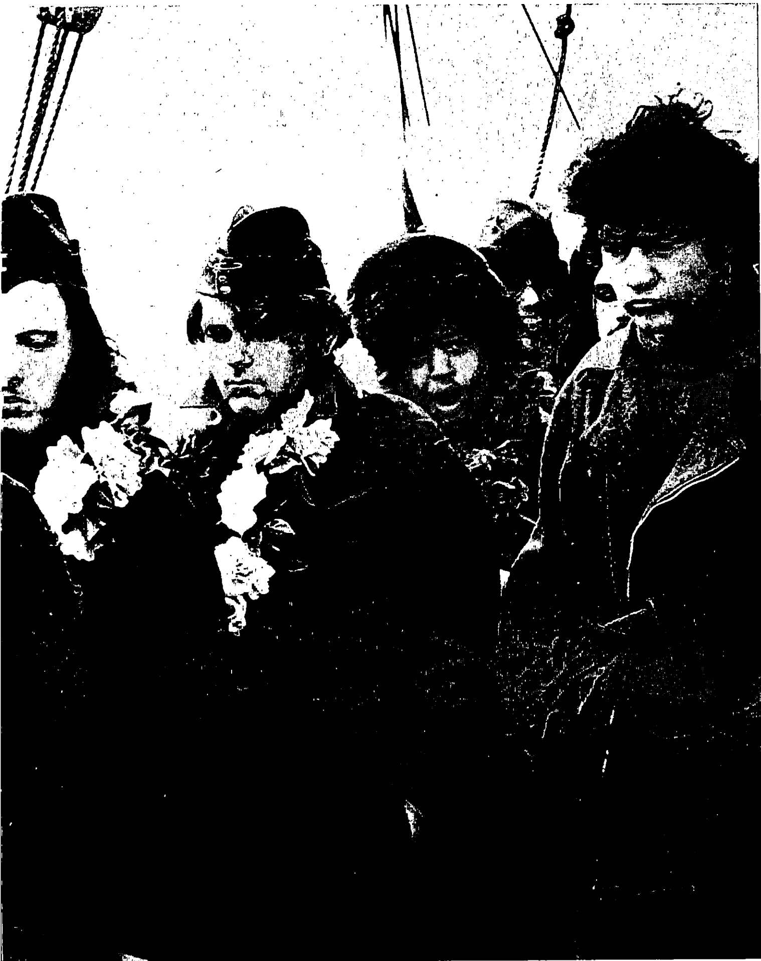
ROBERT CHARLEBOIS (A L'EXTRÊME-DROITE) DANS « JUSQU'AU CŒUR », DE JEAN PIERRE LEFEBVRE